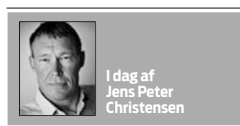
I dag af Jens Peter Christensen

Men efter et par år i skærsilden venner man sig til varmen. Man kommer i form. Det er som at blive udtaget til landsholdet. Man kom-