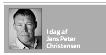
I dag af Jens Peter Christensen

Aftaler om lærepladser er helt specielle, fordi det er sådan, at de efter en kort prøvetid er uopsigelige i hele læreperioden. Bestemmelsen i erhvervsuddannelseslovens § 61, stk. 2, gør så en undtagelse: Hvis en væsentlig forudsætning brister for en af parterne, ja så kan uddannelsesaftalen brydes. Men hvordan skulle den undtagelse forstås?